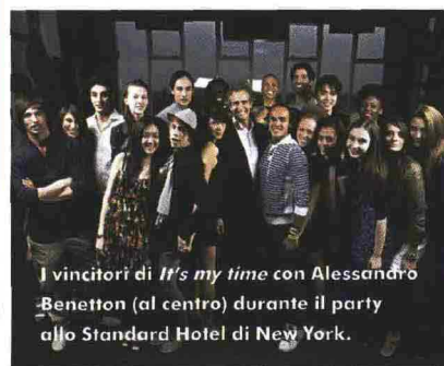
I vincitori di It's my time con Alessandro Benetton (al centro) durante il party allo Standard Hotel di New York.

Dall'Islanda allo Zimbabwe, dal Nepal al Guatemala. Migliaia di partecipanti provenienti da tutto il mondo hanno preso parte a It's my time , il casting globale di Benetton. I venti vincitori, testimoni della vocazione internazionale del brand, parteciperanno alla campagna di Benetton per l'autunno-inverno 2010.