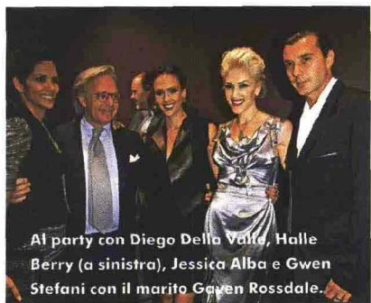
Al party con Diego Della Valle, Halle Berry (a sinistra), Jessica Alba e Gwen Stefani con il marito Gavin Rossdale.

Rodeo Drive si conferma meta dello shopping per tutta Hollywood. Nella prestigiosa via di Beverly Hills (Los Angeles), Diego Della Valle ha ristrutturato la boutique Tod's con l'aiuto di due premi Oscar: lo scenografo Dante Ferretti e la costumista Milena Canonero che, per l'occasione, ha creato un'edizione limitata della borsa Script bag .