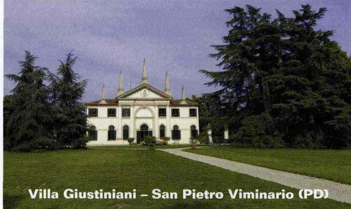
Villa Giustiniani – San Pietro Viminario (PD)

il movimento dell'acqua per fornire equilibrio ed energia all'ambiente o l'orto urbano una realtà sempre più diffusa tra le metropoli moderne.