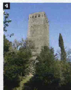
Ritaglio stampa ad uso esclusivo del destinatario, non riproducibile.