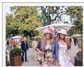
L'apertura di Orticola (Foto gramm a)

Vivaisti e specie rare, mondanità e piantine a un euro