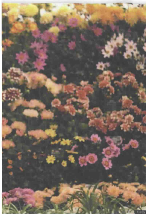
A fianco, il Chelsea flower show di Londra; a sinistra in basso, la mostra-mercato Orticola a Milano

se è quella anglosassone, del Chelsea flower show (che aprirà invece dal 22 fino al 26 maggio a Londra). E come per quest'ultimo, che nasce sotto l'ala della Royal Horticultural society ( www.rhs.org.uk ), anche dietro alla mostra-mercato italiana c'è una storica istituzione ottocentesca come Orticola di Lombardia. Senza fini di lucro, è stata tra le prime istituzioni italiane a promuovere già nel 1865 la conoscenza delle piante, dell'arte dei giardini e del paesaggio vegetale spontaneo. E se l'edizione 2012 del Chelsea flower show presenterà molte novità, a partire dalla nuova area Fresh (dove si potranno ammirare sistemazioni per giardini di taglio moderno) e da Rhs environment (soluzioni verdi per aree urbane problematiche), anche a Orticola 2012 saranno numerose le iniziative. «Abbiamo siglato una convenzione con l'orto botanico di Milano e