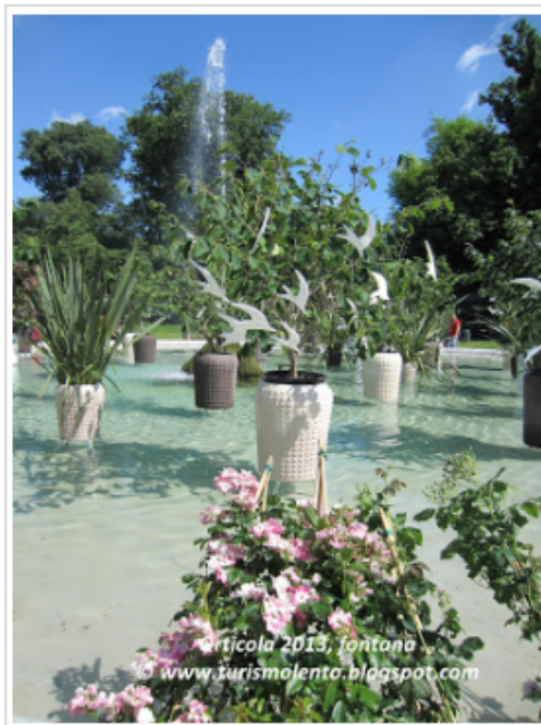
Orticola 2013, Fontana

Orticola 2013: Fragola di bosco, Agrumi, ciliegie e mele dimenticate, Azalea mollis, Cranberry, Rose nostalgiche.