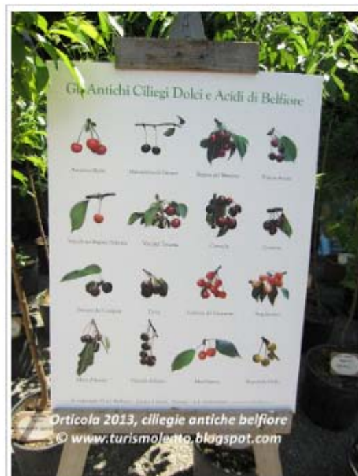
Ciliegie antichi e dimenticati: Amarena Reale, Durone dei Campini, Mora d'Arezzo, Visciola di Roma, Corniola