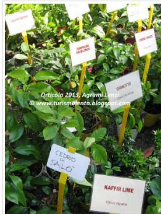
Agrumi varietà antiche e poco note come : Calamondin, Chinotto, Cedro di Salò, Limone Peretto, Limone vinato, Limone rosso, Kaffir lime