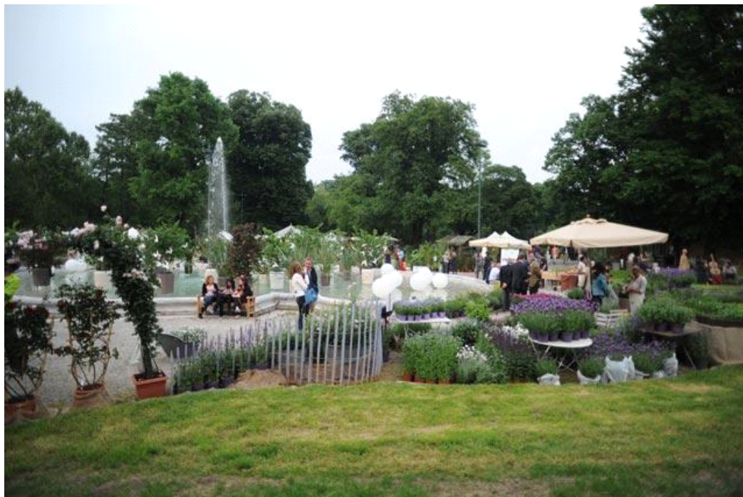
L'edizione 2013 di Orticola

Cosa sarebbero i monumenti italiani senza i loro giardini?