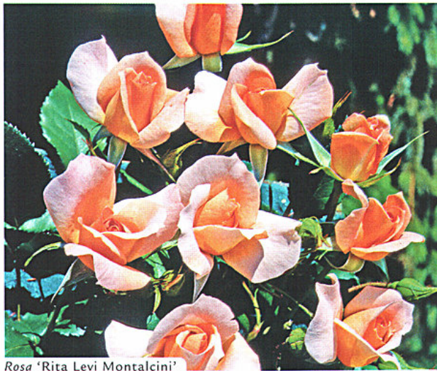
Rosa 'Rita Levi Montalcini'