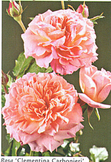
Rosa 'Clementina Carbonieri'

In questa pagina: alcune varietà di rose ottenute nel tempo dagli ibridatori italiani. Sotto: un'immagine della scorsa edizione.