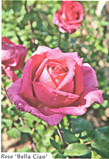
Rosa 'Bella Ciao'