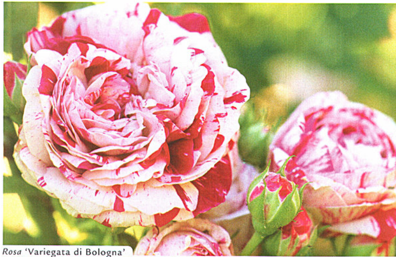
Rosa 'Variegata di Bologna'