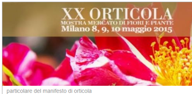
particolare del manifesto di orticola

75 espositori alla manifestazione di Milano Orticola 2015 nella sua 20esima edizione.