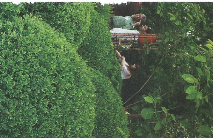
Sopra e a sinistra, la passata edizione di Orticola: a destra, l'ingresso di via Palestro; in alto a destra e sotto, il Festival degli Orti a Monza

Per la sua quarta edizione griffata Expo, il Festival degli Orti riflette sul tema del cibo esplorando la terra, l'orto, l'architettura rurale e urbana. Organizzata da Terralab3.0 con il comune di Monza e il Consorzio Villa Reale e Parco di Monza, la manifestazione ospitata nei giardini delle Serre della Villa Reale dal 13 al 24 maggio, dalle 10 alle 21, prevede un calendario di seminari, laboratori, showcooking ed esposizioni. Se il 16 maggio, nell'ambito del Green Speech, esperti internazionali si confrontano sul tema "Nutrire la città: nuove forme di agricoltura urbana, welfare e paesaggi" - con uno sguardo anche al Food Design - nell'area Showcooking una grande cucina open air ospita degustazioni e performance di cuochi del territorio che realizzano piatti con i prodotti dell'orto, non dimenticando le ricette della tradizione Brianzola. Installazioni vegetali nel prato dei Giardini delle Serre dove sfilano i progetti selezionati dal concorso di idee "L'orto in tavola" rivolto a progettisti del settore, mentre il 13 maggio dalle 15 le signore di ogni età possono partecipare al simpatico concorso floreale "Orti in testa" indossando un adorno floreale abbinato a un abito scelto tu per l'occasione. La premiazione avverrà la sera stessa. Molti i laboratori per i più piccoli come quello per maghetti alla scoperta della buona merenda (4-10 anni), organizzato dal Cam di Monza, il 17 maggio, alle 16. Il programma è su www.festivaldegliorti.it . Ingresso libero.