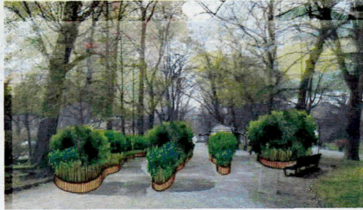
Sopra e a sinistra, la passata edizione di Orticola ; a destra, l'ingresso di via Palestro ; in alto a destra e sotto, il Festival degli Orti a Monza