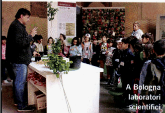
A Bologna laboratori scientifici

Dal 27 aprile all'8 maggio Biodivertiti! A scuola di Biodiversità. A Bologna due settimane di laboratori scientifici, attività educative, atelier che coinvolgono i 5 sensi, exhibit per esplorare la bellezza e la variabilità della natura e promuovere l'attenzione ed il rispetto per l'ambiente dedicati ai bambini, anche piccolissimi (dai 2 anni) e le loro famiglie ( scuoladelleidee.it ).