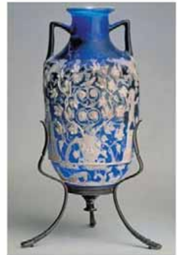
Anticario detto Vaso blu. Metà I secolo d.C. Da Pompei.