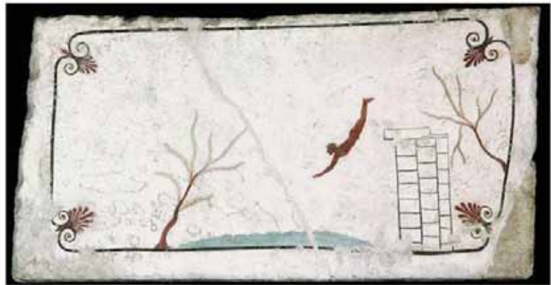
Lastra tombale dipinta: un giovane si tuffa nel mare. Da Paestum, località Tempa del Prete (Sa). Paestum (Sa), Museo Archeologico Nazionale. Su concessione del Ministero dei Beni e delle Attività Culturali e del Turismo: Museo Archeologico Nazionale di Paestum, gabinetto fotografico/foto di Francesco Valetta e Giovanni Grippo