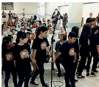
FESTA Tanti i momenti allegri per piccoli ricoverati