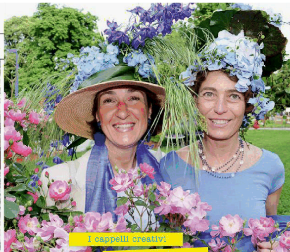
I cappelli creativi di Orticola