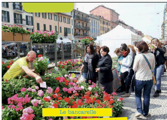
Le bancarelle sul Naviglio Grande