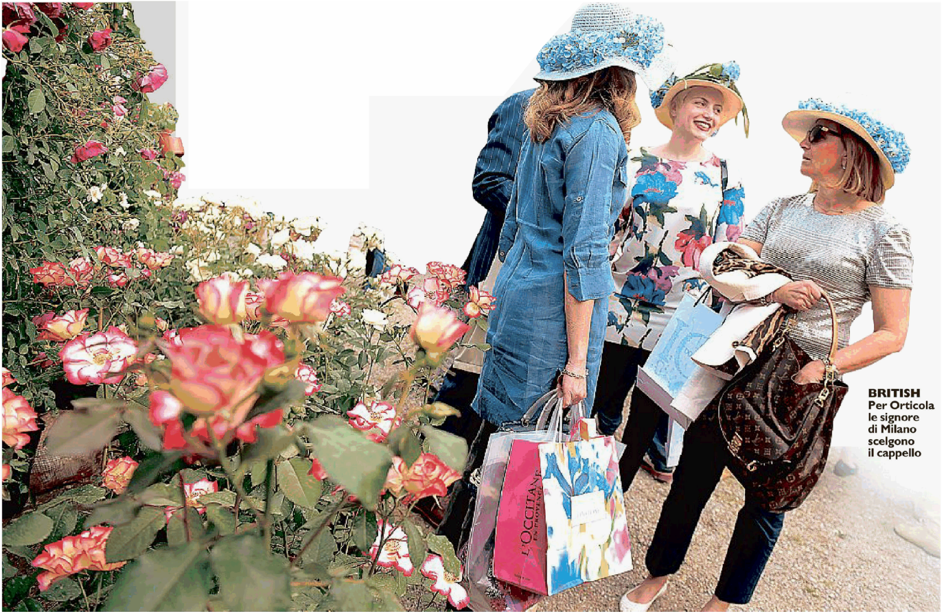
BRITISH Per Orticola le signore di Milano scelgono il cappello