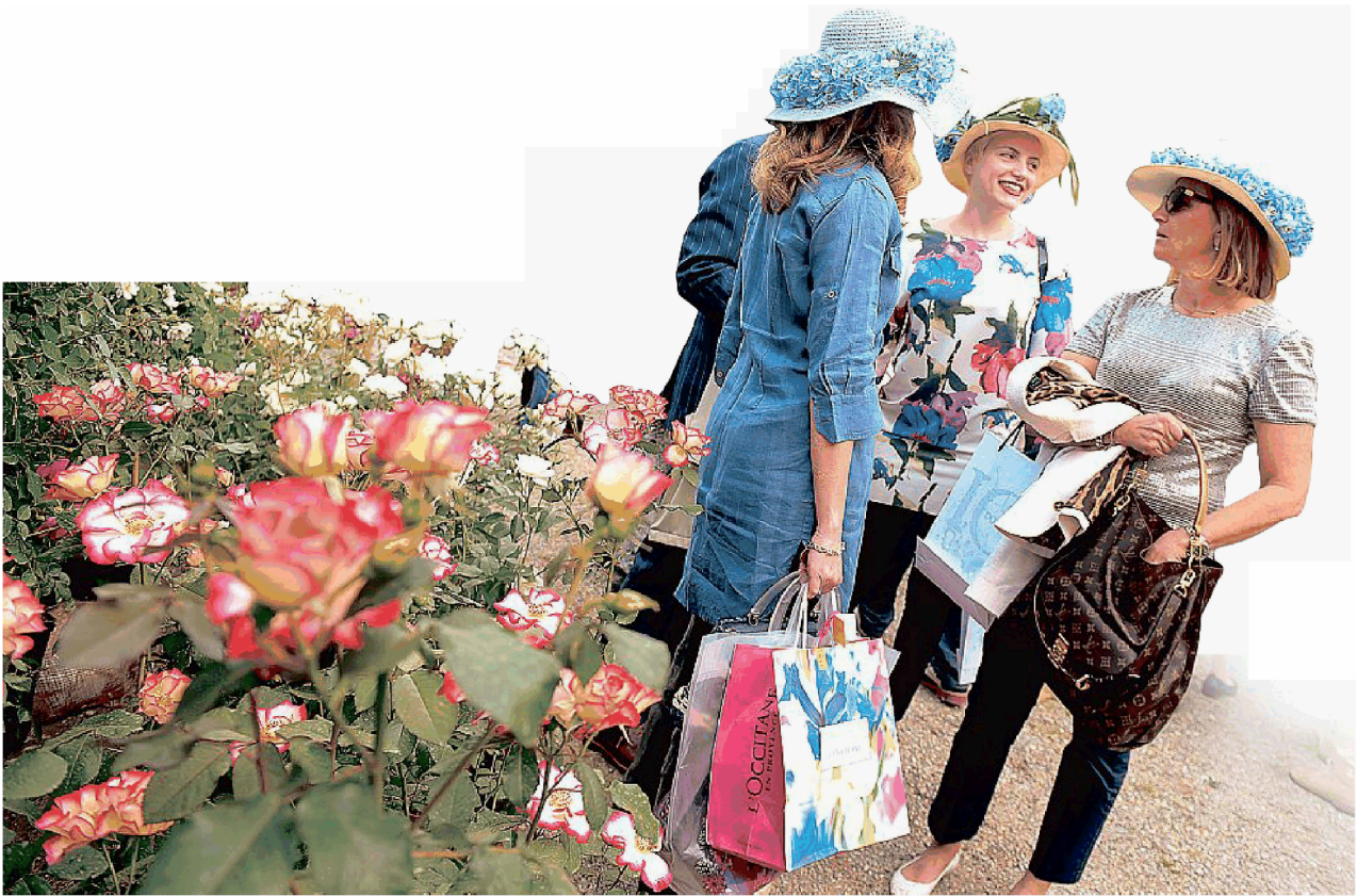
BRITISH Per Orticola le signore di Milano scelgono il cappello