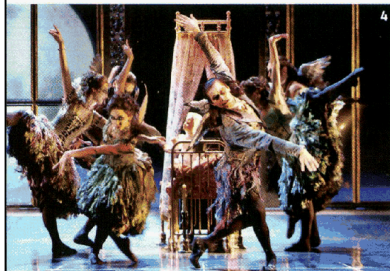
4. Una scenografia di Sleeping Beauty , agli Arcimboldi. La coreografia è di Matthew Bourne. 5. Base , nuovo spazio culturale e ricreativo in zona Tortona.

Inaugurano spazi dedicati alla profumazione d'ambiente, settore sempre più in crescita. Dopo la boutique Locherber Milano , un atelier à parfum sofisticato ed elegante, dal design rétro (corso Magenta 30, tel. 02.45.47.10.01), è stata aperta a Brera un nuovo punto vendita di Culti , che ha ideato nel 1990 il sistema di diffusione con bastoncini in midollino (via Fiori Chiari 6, tel. 02.36.55.38.75).