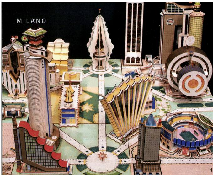
1. Bodys Isek Kingelez, Kimbembele Ihunga (particolare, 1994). Alla mostra 2050. Breve storia del futuro , a Palazzo Reale. 2. La boutique Locherber: profumazioni d'ambiente . 3. Tartare di gamberi con emulsione agli agrumi e passion fruit, alla Trattoria Bertamè .

touchscreen e sensori inglobati, rende il visitatore protagonista in uno spazio che reagisce alla sua presenza e ai suoi gesti (p.za Duomo 12, studioazzurro.com). Sempre a Palazzo Reale si visita, fino al 29, la mostra 2050. Breve storia del futuro : 50 fra dipinti, sculture, foto, video, installazioni di 46 artisti internazionali, indagano il futuro in un'esposizione ispirata al saggio Breve storia del futuro dell'economista francese Jacques Attali (2006, ripubblicato nel 2016 da Fazi Editore, con aggiornamenti sui nuovi scenari globali).