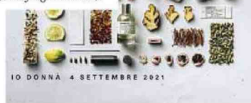
IO DONNA 4 SETTEMBRE 2021

Per chi ama i profumi deluxe, il marchio newyorkese Le Labo è un must. Fino al 30 settembre le sue "City Exclusive" (vendute solo nelle città per cui sono state create) saranno disponibili in tutti i negozi e anche online: insieme al nuovo Cedrat 37, dedicato a Berlino ( lelabofragrances.com ).