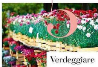
Fiori esposti a Orticola di Lombardia.