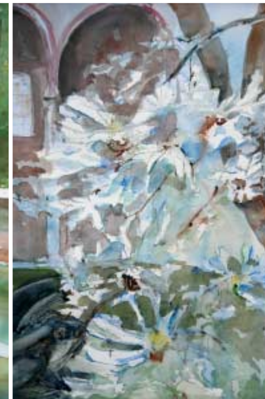
Nel chiostro delle Grazie a Milano Acquarello cm 35x50