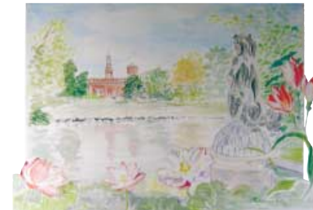
Castello Sforzesco Fiori di loto - Papaveri Acquarello e collage cm 53x39