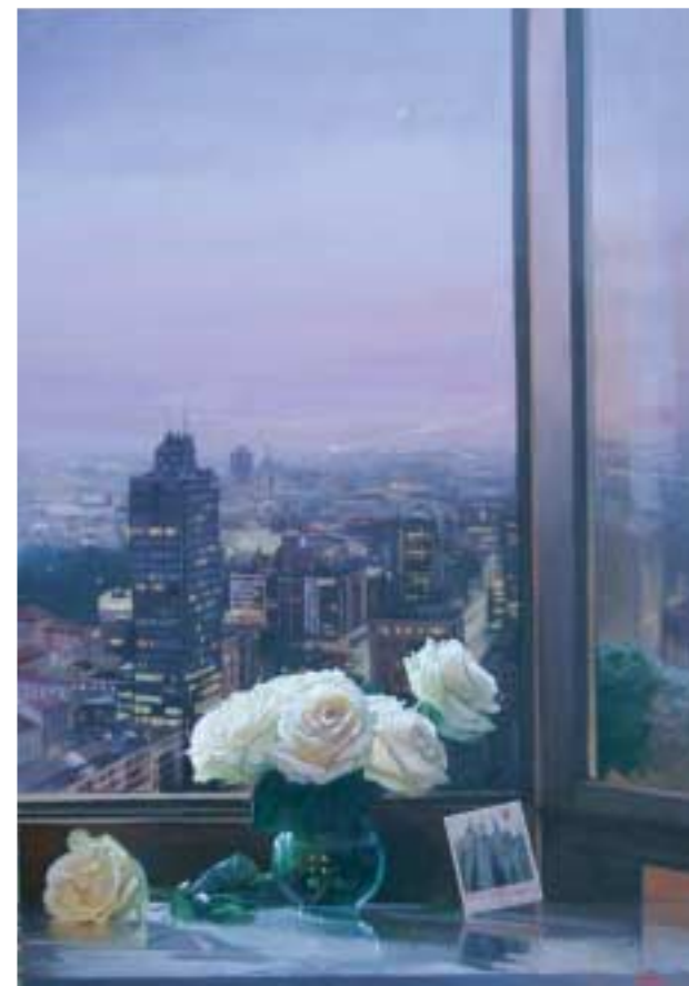
Otto rose alla finestra Olio su tela incollata su tavola cm 70x100