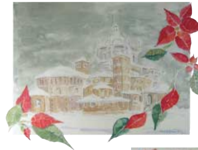
Basiliche Stella di Natale Acquarello e collage cm 50x37