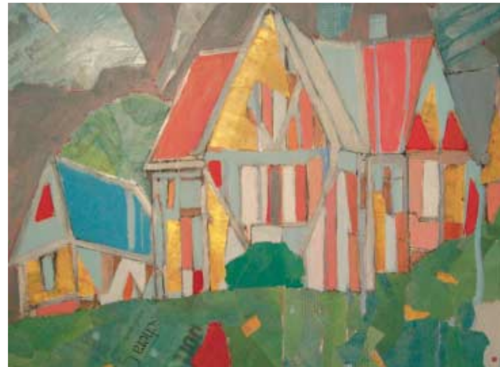
Le ville inglesi a Milano

Tecnica mista e collage su tela cm 80x60