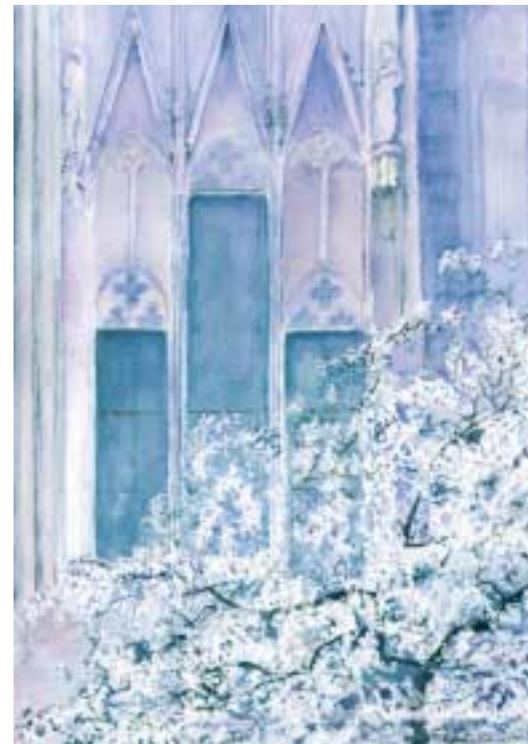
Magnolia al Duomo Acquarello cm 31x41