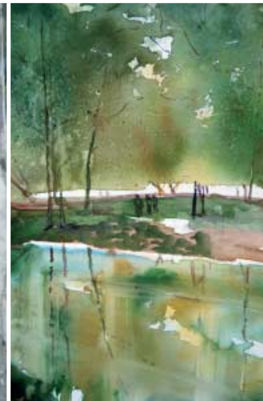
I Giardini Pubblici a Milano Acquarello cm 35x50