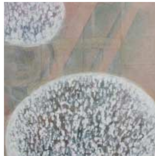
Rotonda della Besana