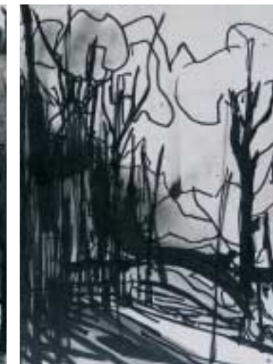
Bosco 2006 (dittico) Inchiostro e tecnica mista su carta cm 28x38