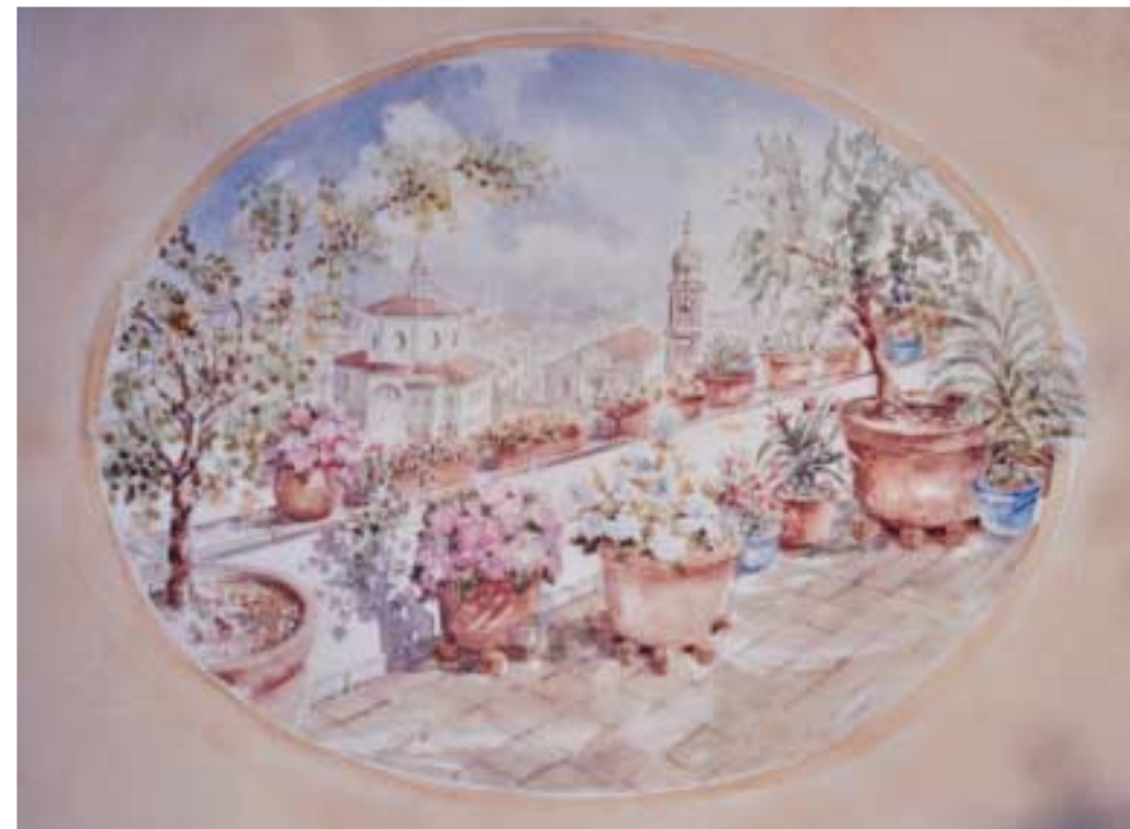
Scorcio di Milano fiorita