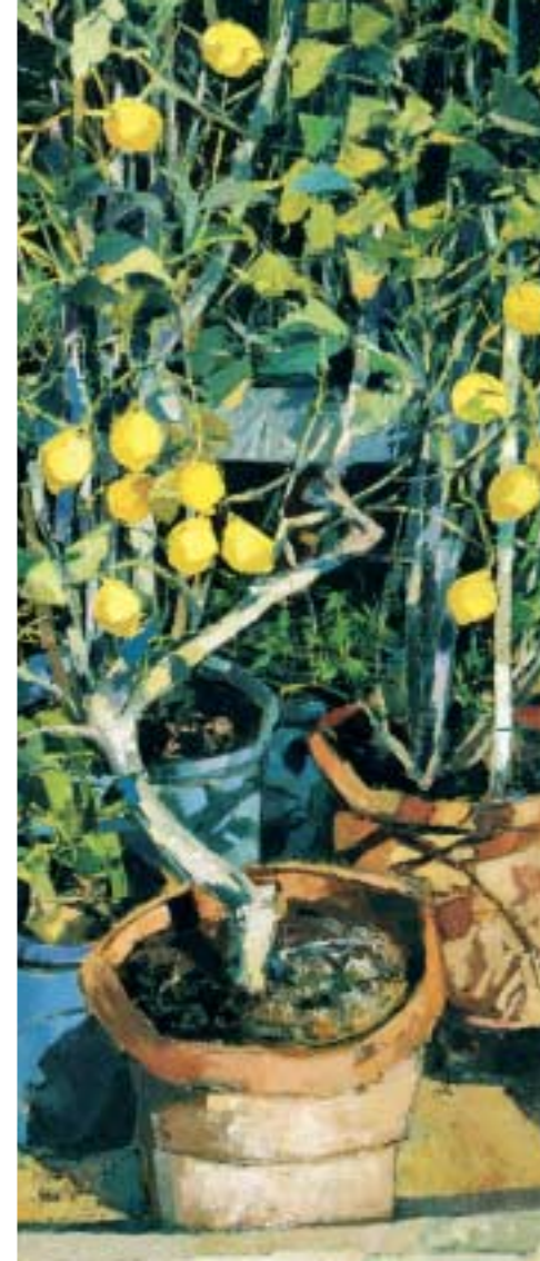
Pianta di limoni 2006