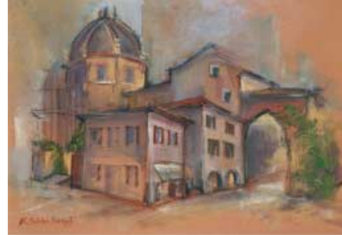
S. Lorenzo al crepuscolo Tecnica mista cm 80x60