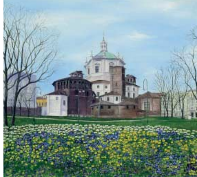
Chiesa San Lorenzo vista da Molino delle Armi