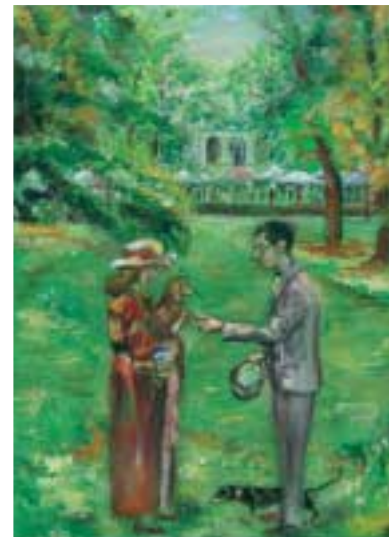
Giardini Pubblici primavera