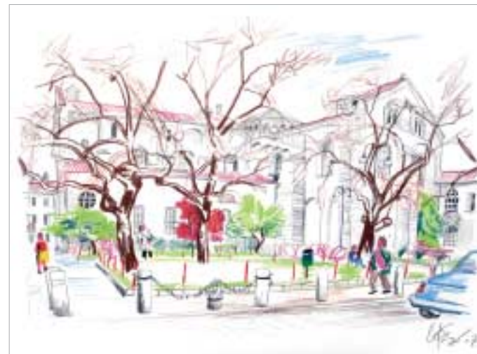
Chiesa di San Smpliciano

Matita e pastello a cera su carta cm 60x45