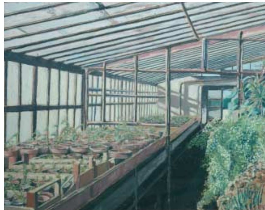
La serra Pastello grasso cm 90x58

Medico, nato a Milano. Ha sempre coltivato la passione della pittura, in dimensione esclusivamente dilettantistica, preferendo la tecnica dei pastelli grassi. Ha l'hobby del giardinaggio da cui l'attrazione a dipingere fiori ed angoli del giardino della Brianza dove abitualmente abita e che, peraltro, è la casa del nonno Emilio Gola, pregevole pittore a cavallo tra l'800 e il 900.