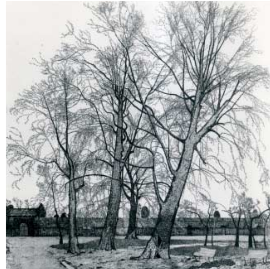
Platani all'Arena Acquaforte cm 49,5x49,7