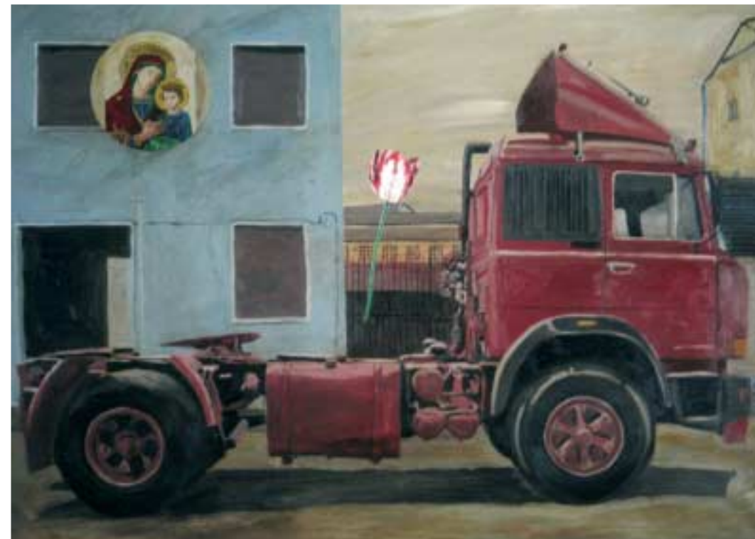
Bovisa Olio su tela cm 125x90

Nato a Torino. Nel 1978 ha avuto la sua prima mostra personale a Roma (Studio Mara Chiaretti). L'ultima mostra personale è stata a Settembre del 2005 a Milano da Atonia Jannone.