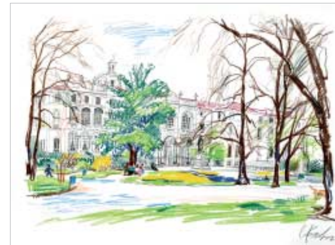
Giardini di via Palestro

Matita e pastello a cera su carta cm 60x45