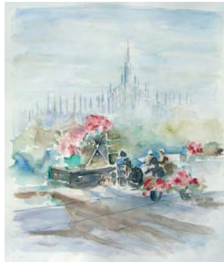
Acquarello cm 38x44

Ha partecipato a varie mostre a Milano e provincia, ultima delle quali alla Galleria Bolzani di Milano nel 2006.