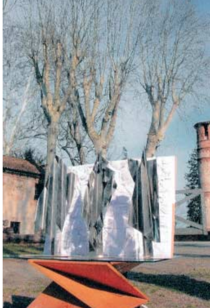
Geometrie in natura con castello Carta cm 100x70 (pannello di carta)