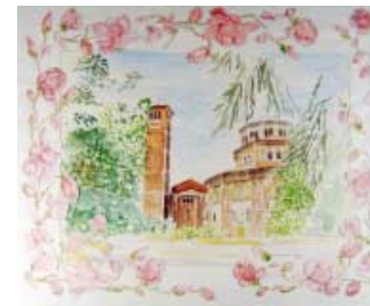
San Celso Magnolia Giapponese Acquarello e collage cm 53x43