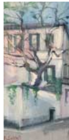
Il platano di zio Amedeo Tecnica mista cm 30x60