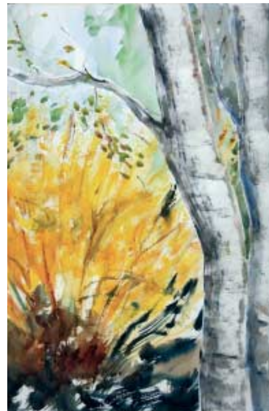
All'ombra delle betulle Acquarello cm 56x75