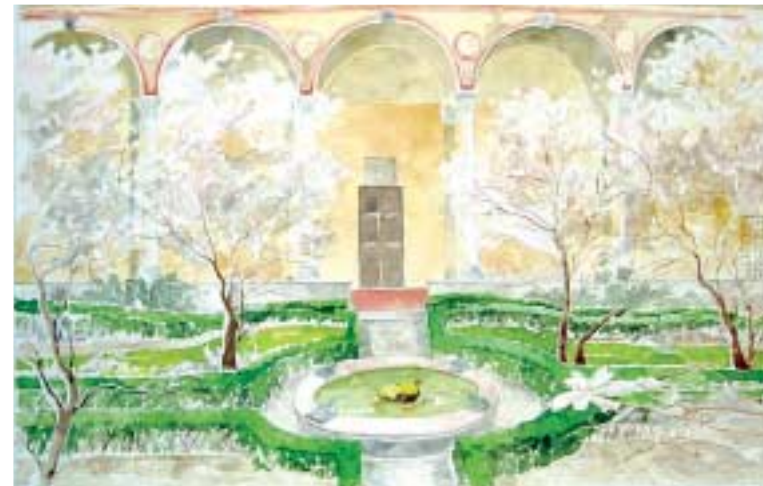
All'ombra di Bramante Il Chiostro di Santa Maria delle Grazie Acquarello su carta cm 50x30