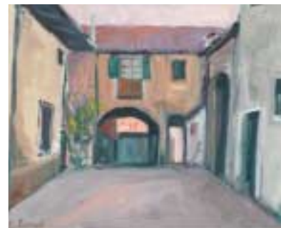
Corte di periferia Tecnica mista cm 50x40