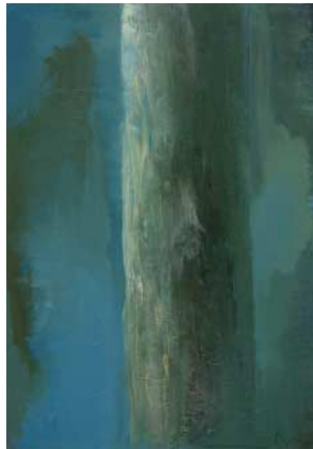
Faggio Olio su tela cm 60x80

Pittore, nato a Bellano, sul Lago di Como. La sua attività, partita dal disegno e dalla grafica, si rivolge presto verso la pittura e si è recentemente aperta alla scultura. L'inizio è segnato dall'incontro con Giovanni Testori e alla partecipazione alla mostra Artisti e Scrittori presso la Rotonda della Besana di Milano. Dopo alcune personali, la sua pittura si concentra sulla tragedia che distrugge parte della Valtellina alla fine degli anni Ottanta, facendo confluire il lavoro in Paesaggio Cancellato , mostra curata da Roberto Tassi (1990). Continuo, nella ricerca artistica, l'interesse per il ritratto, che trova affermazioni in mostre e pubblicazioni. Legatosi alla fine degli anni Novanta al gruppo dell'Officina Milanese, si registra nella sua produzione un'inversione di interesse contenutistico: scopre il Sud, attraverso la Sicilia. In questa nuova luce nascono: Isolitudine con Ferdinando Scianna del 2000 e nel 2003 MIXtura con Franco Battiato. Nel 2004 Electa pubblica Velasco20 , una biografia con un contributo di Giulio Giorello e in occasione di Extramoenia (Palermo e Milano), sempre nel 2004, il catalogo è edito da Charta. Del 2006: Tana , site-specific ideato per il Teatro dell'Arte di Milano. Opere del pittore fanno parte di collezioni private e pubbliche tra cui: la Collezione Farnesina del Ministero degli Affari Esteri e la Collezione MACRO, Museo d'Arte Contemporanea Roma.