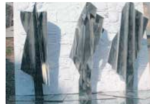
La torretta Acciaio inox cm 100x70