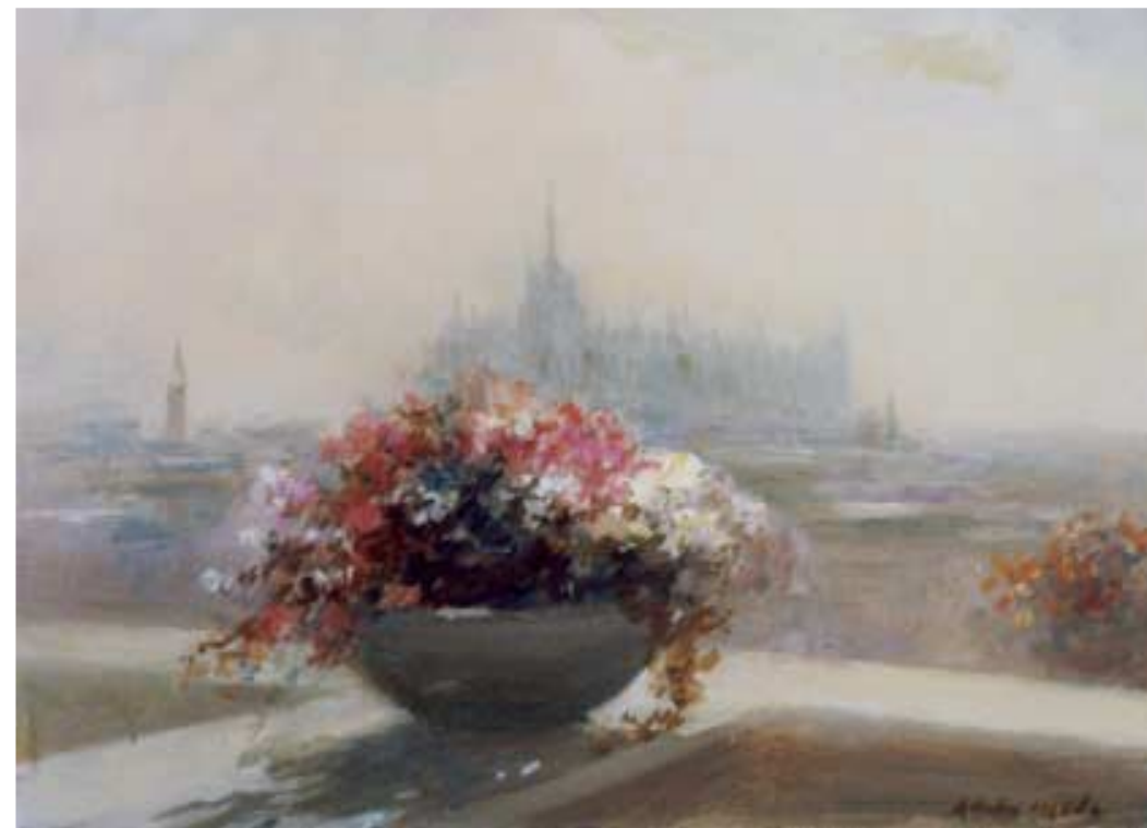
Da un terrazzo di Milano