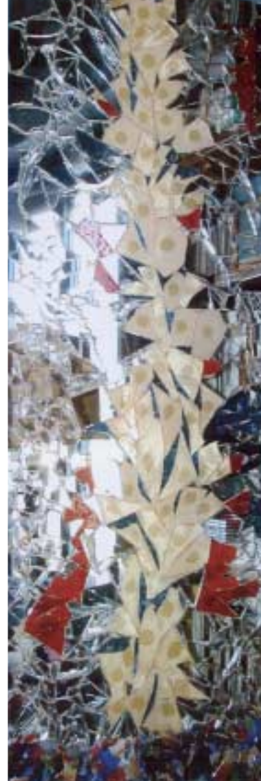
Il vetro nell'immaginario mt 1,73x60