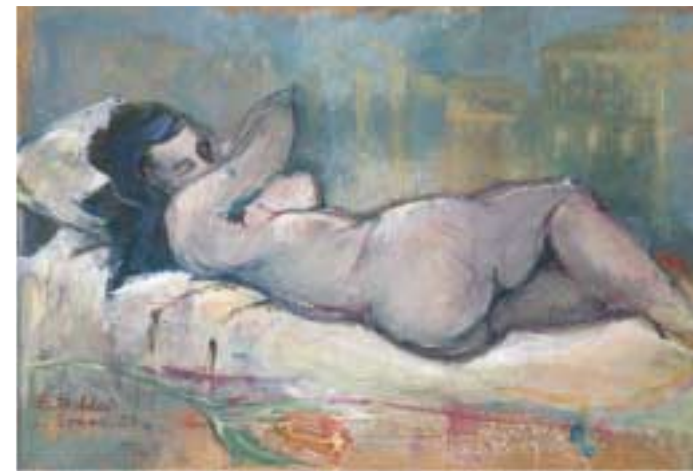
Nudo con fiore Tecnica mista cm 85x65