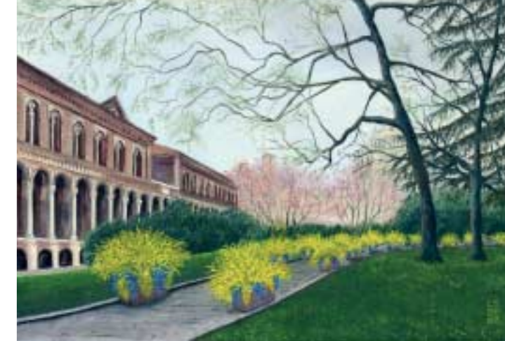
L'Università Statale con forsizia