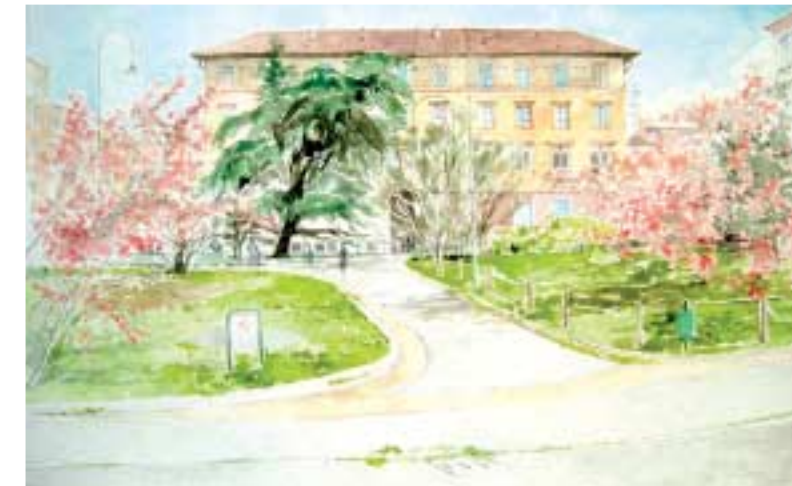
Anticipata primavera Piazza Tommaseo Acquarello su carta cm 50x30